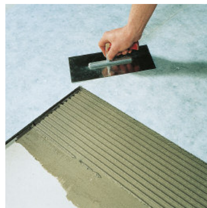
PCI Polysilent® Premium skivorna används som stegljudsreduktion under beläggningar av keramiska plattor och natursten.